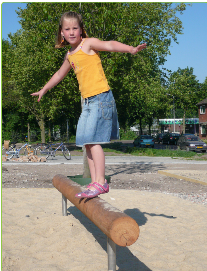
0-52100-300 • K&K Evenwichtsbalk

Hoogte: 0,40 m. Staanders: FSC® gecertificeerd gelamineerd robiniahout met staalvoet Ø120 mm. Metalen onderdelen: roestvast staal